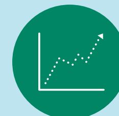
Dib u eegis